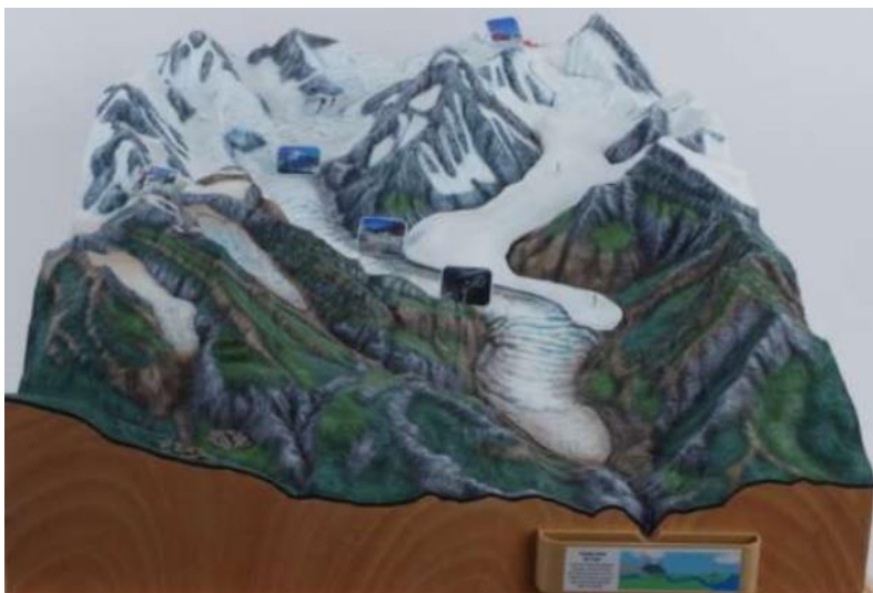
Maquette pédagogique de Glacier de montagne Institut des Géosciences de l'Environnement